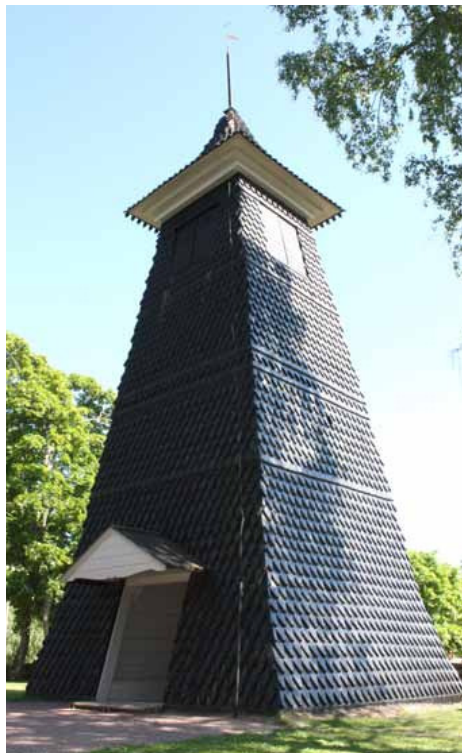
Siunatkoon kaikkivaltias Jumala, Isä, Poika ja Pyhä Henki jokaista kirkossa kävijää!