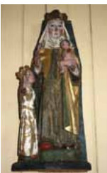
Pyhä Anna kolmantena 1400-l. lopulta ja Isä Jumala 1500-luvulta.